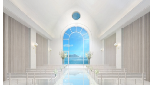
ナウパカチャペル

■ ナウパカチャペル ハワイで愛の象徴として語り継がれてきたナウパカの花の名前を冠したチャペル。高さ7mの窓から見える素晴らしい景色に加え、大理石のバージンロードに映り込むおふたりの姿が幻想的です。