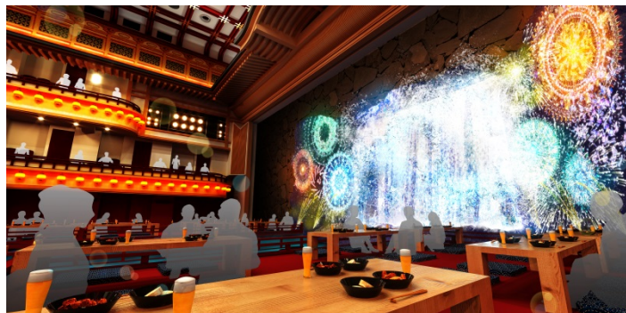
「昼まつり - HIRUMATSURI -」場内イメージ図

昨年11月に新開場した南座の新機構「客席フルフラット化」を活用し、昼と夜で演出の異なるお祭りを創りあげます。