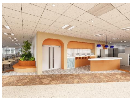
会話がしやすい温かな雰囲気のパントリー 執務中の一休みスペースとして活用

同時に、オフィスカジュアルの導入や、ガラス張り会議室の採用、役職者席の廃止に加え、 社長のトップダウンによる役職名呼びの廃止と「さん呼び」の導入を進めることで、役職や年次、部署にとらわれず、フラットで発言しやすい組織文化への転換を図ります。