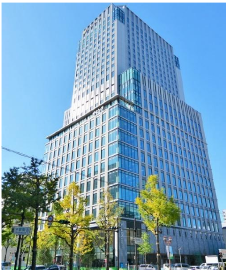
オービック御堂筋ビル外観 ※5階ワンフロア・4階の一部に入居

当社は、2029年度にむかえる創立100周年事業の一環として、さらに、2026中期経営計画で掲げる方針「人材及び事業活動の全社最適化」のもと、組織力の強化と人材が力を発揮できる環境づくりを目的に、本店（本社）を移転いたします。