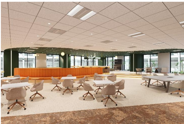
「Blend Stage」には多様なコミュニケーションスペースを配置 塗装には弊社塗料を採用

部門間の連携を強化し、業務効率と意思決定スピードの向上を図ります。本社機能を6フロアから1フロアに集約し、交流・発表やリフレッシュの場となる「Blend Stage」をオフィス中央に設置するとともに、各部署が自然に交わる接点となる「Blend Point」を動線上に配置します。これにより、 部門を越えてすぐに相談・連携ができ、単なる情報共有にとどまらないコミュニケーションを促進 します。議論やアイデア創出が日常的に生まれ、迅速な意思決定と新たな取り組みにつなげていきます。