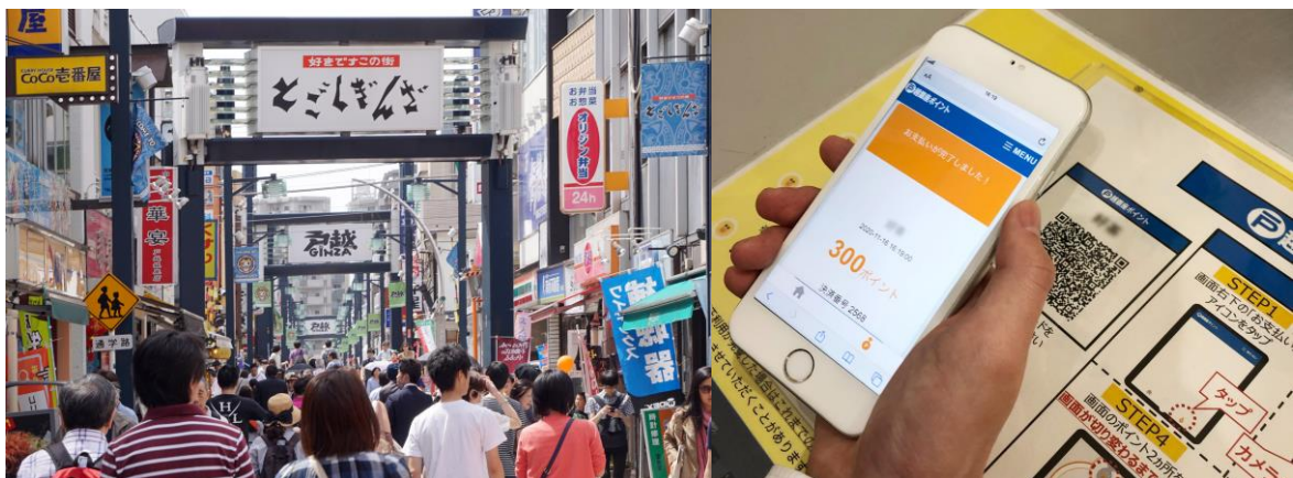
実証実験を実施する戸越銀座商店街(左)とWebアプリケーション(右)

今回の実証実験を通じて、戸越銀座エリアマネジメントは、店舗を含めた利用客のサービス受容性とマーケティング効果を確認し、地域内でのコミュニケーションの活性化や経済循環につなげます。なお、本実証実験は11月20日、21日に戸越銀座商店街内の14店舗を対象に実施し、事前に募集した100名のモニターが参加予定です。