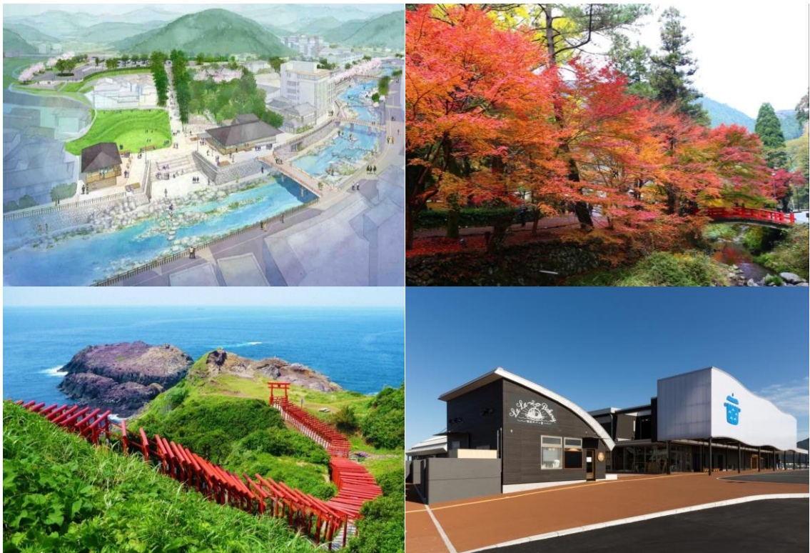
長門市の主な観光スポット(左上:長門湯本温泉、左下:元乃隅神社、右上:大寧寺、右下:道の駅センザキッチン)

具体的には、観光庁補助金(観光地の「まちあるき」の満足度向上整備支援事業)を活用し、長門市内の主要な観光地や交通要所に無料で利用可能な Wi-Fi 環境を整備することで、国内外からの観光客をはじめとした来訪者に対して情報通信手段の利便性向上を図るとともに、位置情報に基づき適切な観光・イベント情報などを発信します。さらに、Wi-Fi 環境から収集したデータを利活用することで、さらなる長門市への集客力の向上および周遊観光の強化を図り、観光振興による地域活性化に取り組みます。