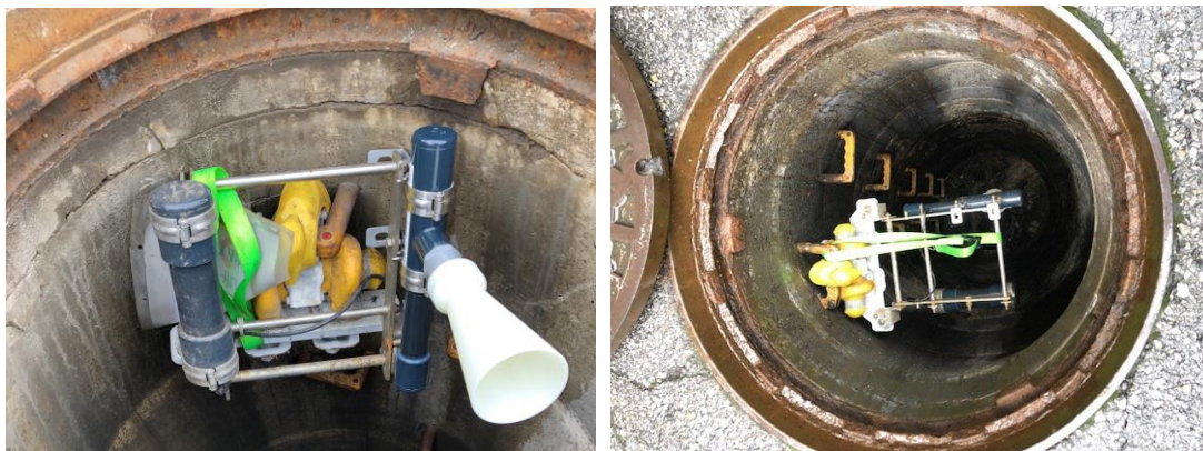
千葉市の下水道汚水マンホールにおける水位監視の実証実験の様子

その結果、油脂や蒸気などが発生する劣悪な環境下の下水道汚水マンホールでも、水位変動をリアルタイムに監視できることを確認しました。