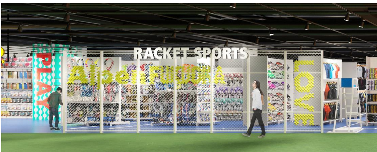
C) ITF（国際テニス連盟）公認テニスコート材を採用したテニスコナー