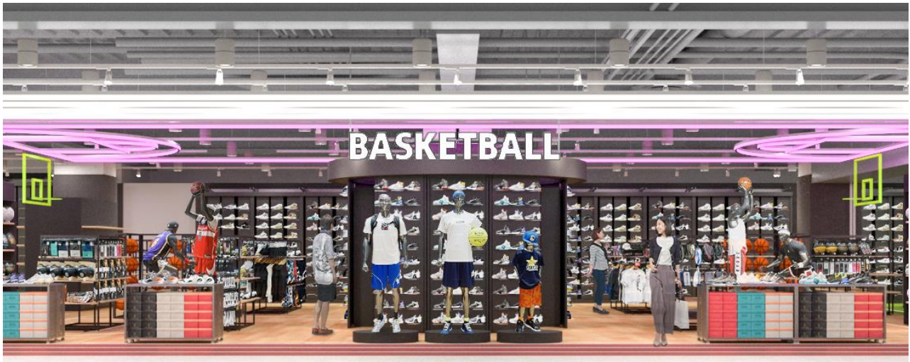
D) NBA コートと同素材のホワイトアッシュ フローリング材を採用したバスケットボールコーナー