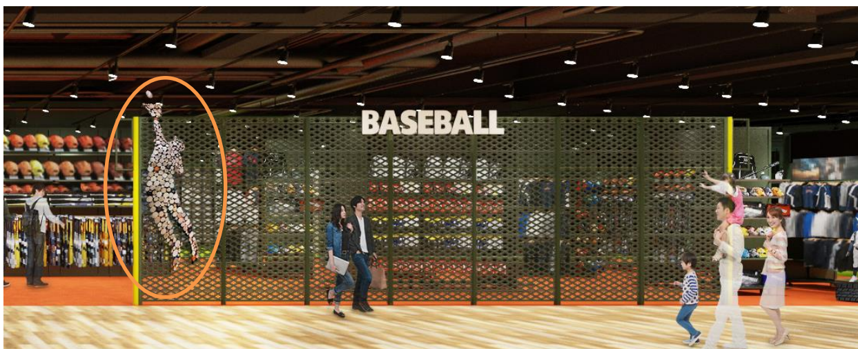
バットを再利用した選手の装飾