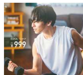
写真はメンズ/ホワイト