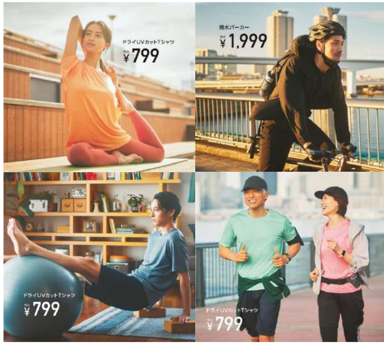
▲着用商品:ドライ UV カット T シャツ(オレンジ、ブラック、ブルーグレー、エメラルドグリーン、ピンク)、撥水パーカー(ブラック、ライトグレー)