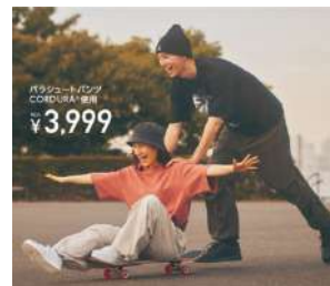
写真はメンズ/ブラック