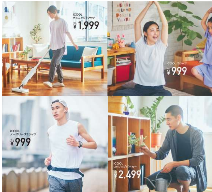
▲着用商品：iCOOL チュニックTシャツ(レディース/ライラック)、iCOOL Tシャツ(レディース/ホワイト)、 iCOOL ノースリーブTシャツ(メンズ/ホワイト)、iCOOL UVジップパーカー(メンズ/ダークグレー)