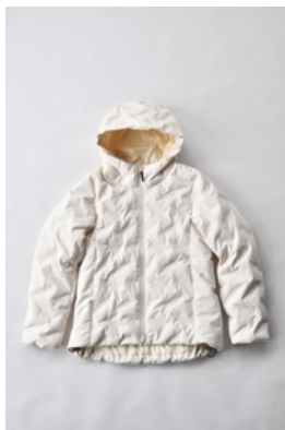
アルミ蓄熱パデッドフードジャケット THEMOLITE (R) 使用/クリーム