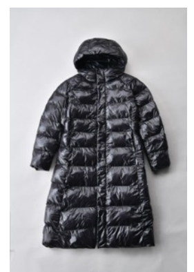
アルミ蓄熱パデットロングコート THEMOLITE (R) 使用 光沢/ブラック