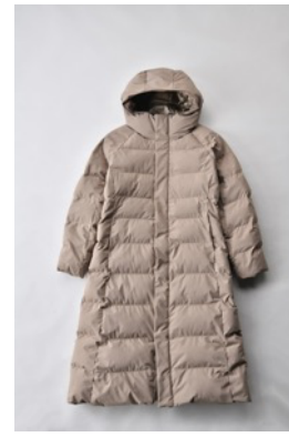
アルミ蓄熱パデットロングコート THEMOLITE (R) 使用/キャメル