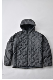
アルミ蓄熱パデッドフードジャケット THERMOLITE (R) 使用/カーキ