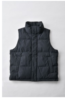
アルミ蓄熱パデッドベスト THERMOLITE (R) 使用/ブラック