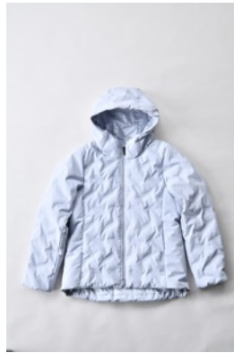
アルミ蓄熱パデッドフードジャケット THEMOLITE (R) 使用/ グレイッシュブルー