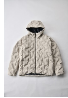
アルミ蓄熱パデッドフードジャケット THERMOLITE (R) 使用/サンド