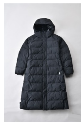
アルミ蓄熱パデットロングコート THEMOLITE (R) 使用/ブラック