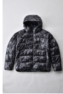
アルミ蓄熱パデッドフードジャケット THERMOLITE (R) 使用 光沢/ ブラック