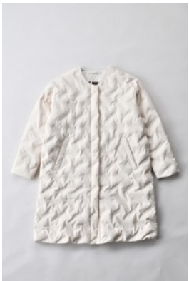
アルミ蓄熱パデットノーカラージャケット THEMOLITE (R) 使用/クリーム