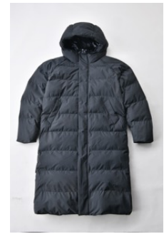
アルミ蓄熱パデッドフードロングコート THERMOLITE (R) 使用/ブラック