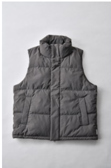
アルミ蓄熱パデッドベスト THERMOLITE (R) 使用/カーキ

ベスト、ジャケット、ロングコートの3型で、ジャケットには通常のコラーのほか、空素材のチャコールグレーと光沢素材のチャコールグレー、ブラックが登場します。