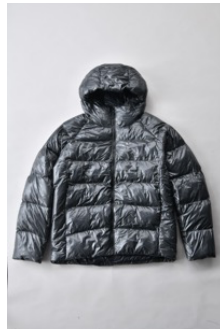
アルミ蓄熱パデッドフードジャケット THERMOLITE (R) 使用 光沢/ チャコールグレー