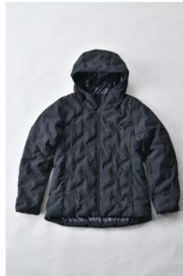
アルミ蓄熱パデッドフードジャケット THEMOLITE (R) 使用/ブラック