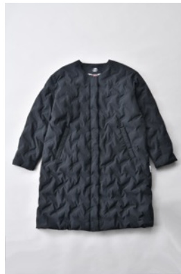
アルミ蓄熱パデットノーカラージャケット THEMOLITE (R) 使用/ブラック