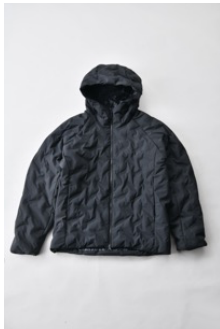
アルミ蓄熱パデッドフードジャケット THERMOLITE (R) 使用/ブラック