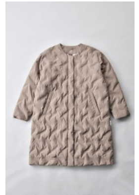
アルミ蓄熱パデットノーカラージャケット THEMOLITE (R) 使用/キャメル