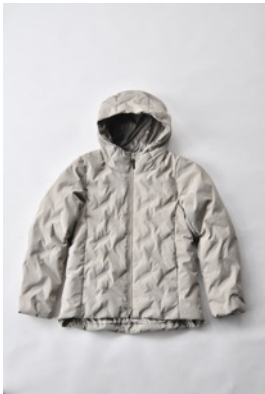
アルミ蓄熱パデッドフードジャケット THEMOLITE (R) 使用/サンド

フードジャケット、ノーカラージャケット、ロングコートの3型で、ロングコートには通常の色のほか、光沢素材のブラックが登場します。