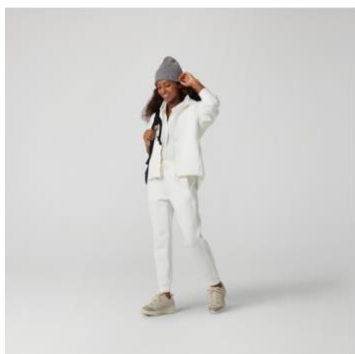
テックスウェットジップパーカー 税抜¥3,990 (税込¥4,389) テックスウェットジョガーパンツ 税抜¥3,990 (税込¥4,389)