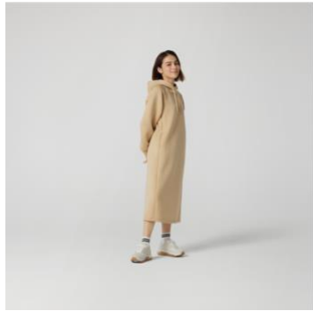
テックスウェットパーカーワンピース 税抜¥4,990 (税込¥5,489)