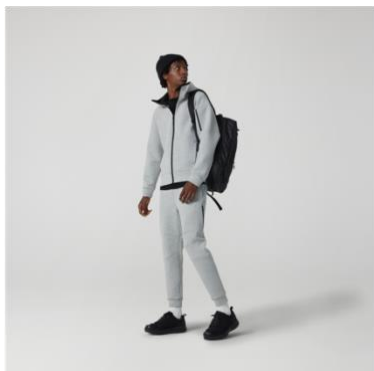
テックスウェットジップパーカー 税抜¥3,990 (税込¥4,389) テックスウェットジョガーパンツ 税抜¥3,990 (税込¥4,389)