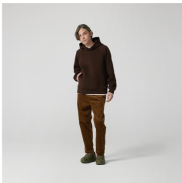
テックスウェットプルパーカー 税抜¥3,990 (税込¥4,389)