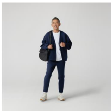
テックスウェットカーディガン 税抜¥3,990 (税込¥4,389) テックスウェットテーパードパンツ 税抜¥3,990 (税込¥4,389)