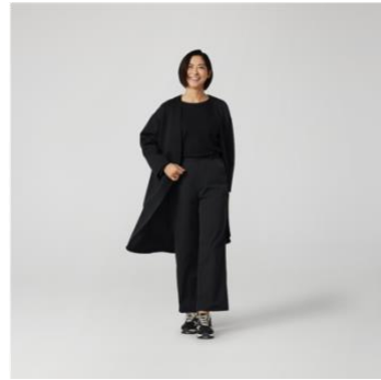
テックスウェットロングカーディガン 税抜¥4,990 (税込¥5,489) ソロテックスストレートパンツ 税抜¥4,990 (税込¥5,489)