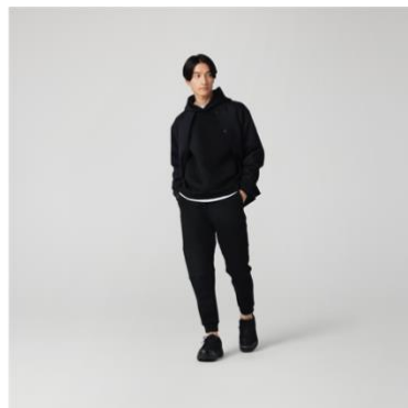
テックスウェットプルパーカー 税抜¥3,990 (税込¥4,389) テックスウェットジョガーパンツ 税抜¥3,990 (税込¥4,389)