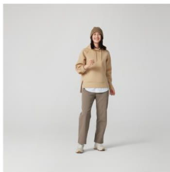
テックスウェットプルパーカー 税抜¥3,490 (税込¥3,839)