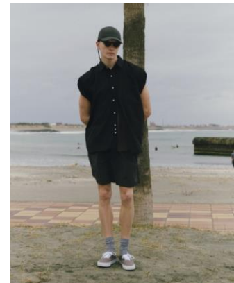
SHIRT ¥10,990 TEE ¥3,999 SHORTS ¥7,999 CAP ¥3,999