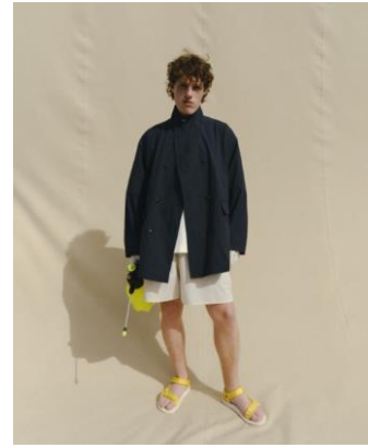
JACKET ¥16,990 TEE ¥4,999 SHORTS ¥6,999