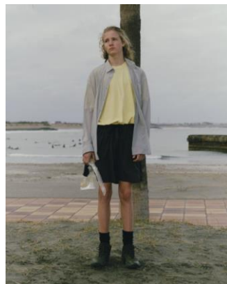
SHIRT ¥9,999 GARMENT DYED TEE ¥4,999 SHORTS ¥7,999