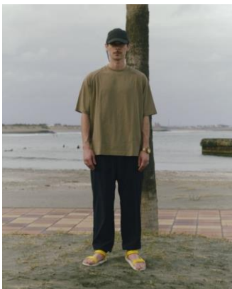
TEE ¥4,999 TRACK PANTS ¥9,999 CAP ¥3,999