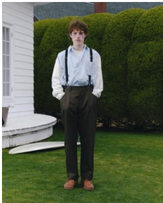
SHIRT ¥11,990 TEE ¥5,999 SUSPENDERS PANTS ¥14,990