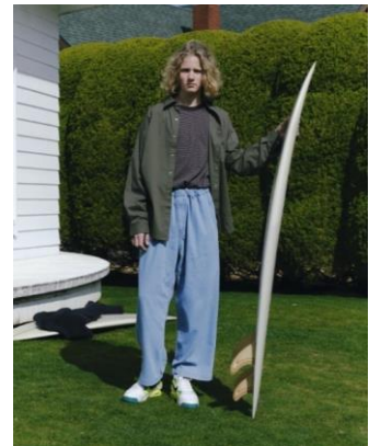
SHIRT ¥11,990 LONG TEE ¥5,999 WIDE PANTS ¥6,999