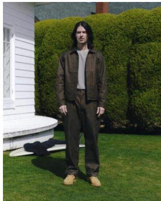
BLOUSON ¥18,990 LONG TEE ¥5,999 SUSPENDERS PANTS ¥14,990