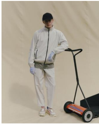
JACKET ¥14,990 LONG TEE ¥5,999 TAPERED PANTS ¥8,999 CAP ¥3,999