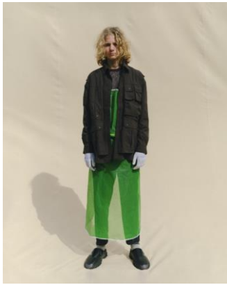
SHIRT ¥20,990 LONG TEE ¥5,999 TAPERED PANTS ¥8,999