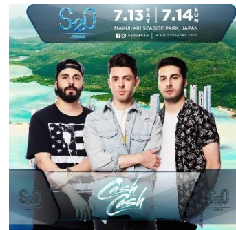
Cash Cash (キャッシュ・キャッシュ)