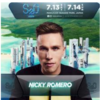
Nicky Romero (ニッキー・ロメロ)