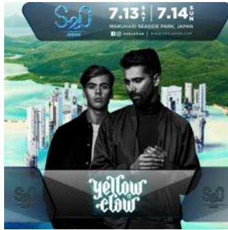
Yellow Claw (イエロー・クロウ)