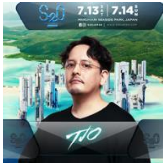
TJO (ティー・ジェイ・オー)