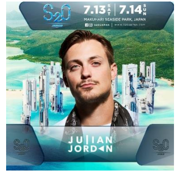
JULIAN JORDAN (ジュリアン・ジョーダン)