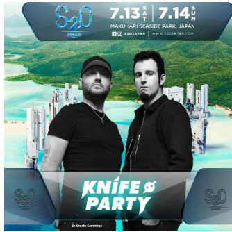
Knife Party (ナイフ・パーティー)