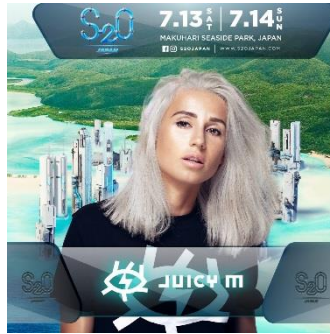
Juicy M (ジューシー・エム)