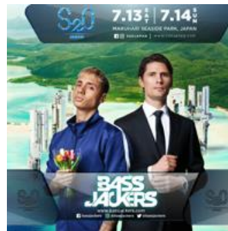
Bassjackers (ベースジャッカーズ)