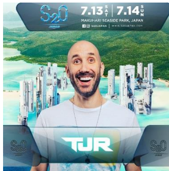
TJR (ティー・ジェイ・アール)