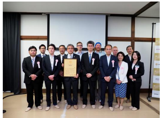
【一般部門】 アウトバウンドカテゴリー受賞者