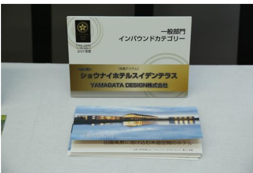
■ 「はやぶさ」「はやぶさ2」 (神奈川県/ JAXA (宇宙航空研究開発機構))