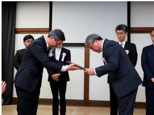
【一般部門】 インバウンドカテゴリー受賞者