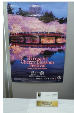
■ 摩天崖とローソク島 (島根県/西ノ島町・隠岐の島町/大山隠岐国立公園)