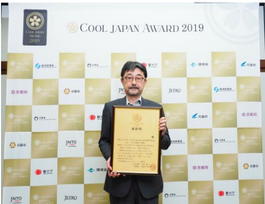
■ ショウナイホテルスイデンテラス (山形県/YAMAGATA DESIGN株式会社)