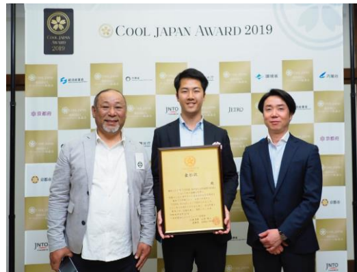
■ 弘前さくらまつり (青森県/弘前市・弘前商工会議所・公益社団法人弘前観光 コンベンション協会・公益社団法人弘前市物産協会)