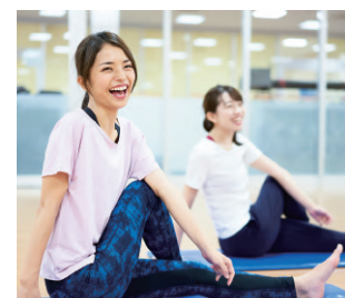
ジム・スポーツクラブなど