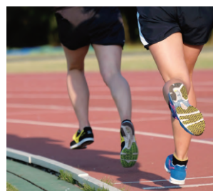
総合スポーツ施設など