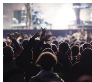
ライブ・コンサートなど