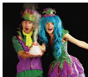
演劇舞台・ミュージカルなど