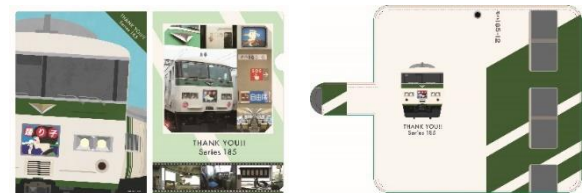
▲クリアファイル 400円(税込)