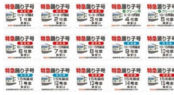
▲ステッカー ※全15種 (1種)440円(税込)