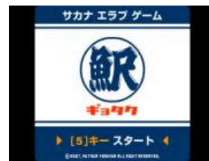
「ギョタク」 / よしだゆたか