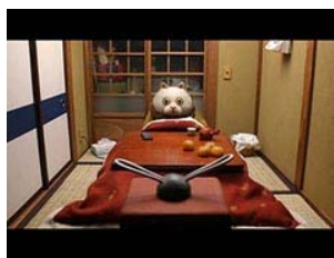
「コタツネコ2」 / 青木純