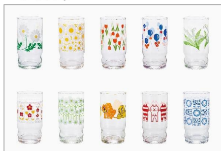
アレンジコップ全10種ラインナップ