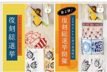
公式Instagramの投稿(2025年3月、9月)