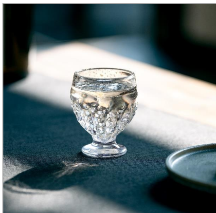
雪の粒を感じる、立体感のある盃

従来の津軽びいどろが持つ多彩な色づかいとは一線を画し、本シリーズでは白を基調とした透明感のある色合いを採用。控えめに配した金箔のあしらいや、絶妙な粒の残し方、淡く陰影の奥に宿る紫のニュアンスなど、職人の高度な技術によって、雪が重なり合うことで生まれる奥行きと静かな陰影を表現しています。積もった雪がつくる澄んだ空気感や、冬の静寂をやさしく感じさせる想いが込められたシリーズです。現在、次なる展開も構想されています。