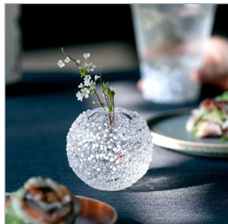
手ざわりで楽しむ、粒感ガラスの一輪挿し