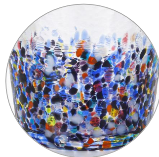
夏の夜空に灯る祭りの情景を表現