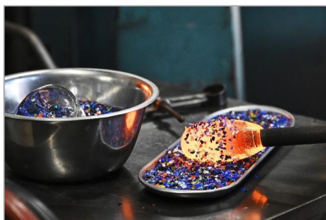
新色「夏祭り」北洋硝子での制作工程