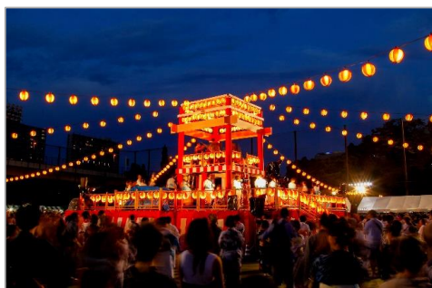
アンケートで多く寄せられた夏祭りのイメージ

【関連リリース】 『津軽びいどろ「にほんの色ふうけい 春の丘」3月10日発売、人気シリーズに新色登場』(2026年3月3日配信) https://prtnews.jp/main/html/rd/p/000000119.000042919.html