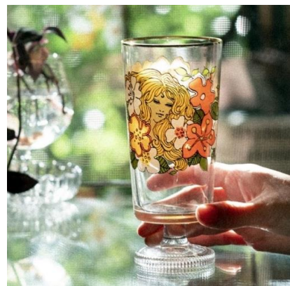
1972年に発売された柄「セニョーラ」を復刻