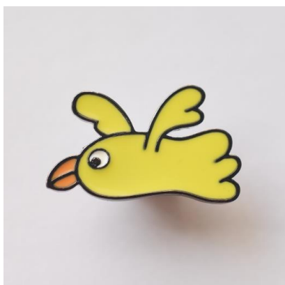
アデリアレトロショップ限定販売 「トリピカル ピンバッジ」