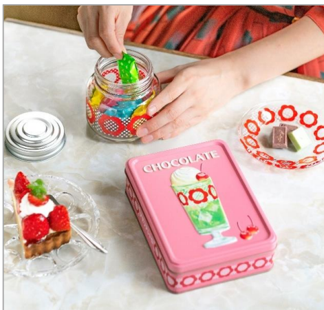
メリーのコラボBOXには花だんの脚付きグラスのデザイン

2024年12月6日(金)より、メリーオンラインショップ限定で「はじけるキャンディチョコレート。×アデリアレトロ コラボBOX」が発売されます。花だん柄の脚付きグラスと、限定デザインのアソートメント缶などがセットになった商品です。このコラボBOX発売をより盛り上げるべく、アデリアレトロからも「ボンボン入れ(ミニ) 花だん」と「プレート120 花だん」を同日に発売する運びとなりました。ボンボン入れにはチョコを入れて楽しんだり、プレートにはチョコを乗せてティータイムなど、コラボBOXのはじけるキャンディチョコレート。と組み合わせるとよりかわいらしく演出できるアイテムです。また、コラボ商品の発売を記念して両社Instagramでプレゼントキャンペーンを実施いたします。