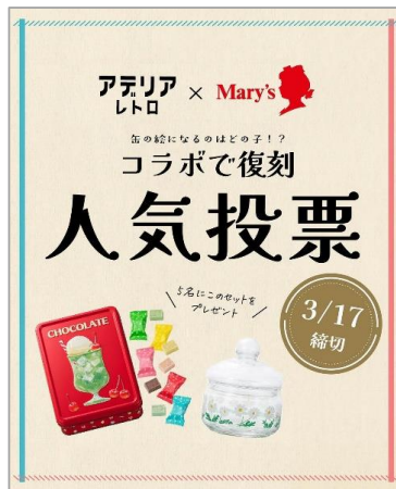
2024年3月 SNSでの人気投票の様子