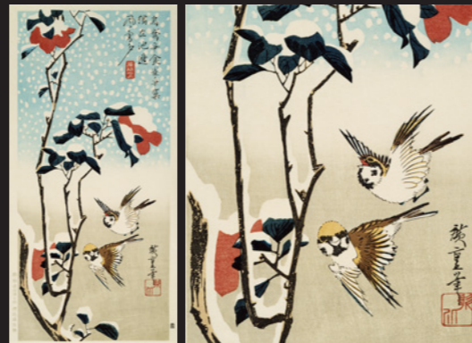
歌川広重「大短冊 雪中椿に雀」(江戸時代)

<寓意> 雀: 庶民性や家内安全、たくましく生きる生命力の象徴。 椿: 生命力や希望を象徴しつつ、儚さや無常をも示す花。 雪: 清浄さや静寂、そして人生の瞬間の美しさや無常を表現。