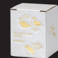
高級感あるパッケージ入り

NEW 燕と柳 酒グラス 6840 ¥1,800 06840 8 最大65 口58 高78 容145 箱サイズ：長68×幅68×高84 1×36=36p/c入 JAN