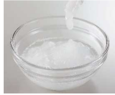
熱中対策水アイススラリー中身