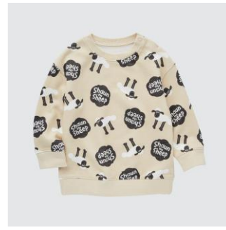
クレイアニメーション スウェットシャツ (長袖) 1,990 円(税込)

いたずらな表情がかわいいショーンをフリースのアップリケで表現。もこもこ触って楽しめる一枚です。程良いリラックス感のあるスウェットは、彼をイメージした元気なイエローカラーをチョイスしました。