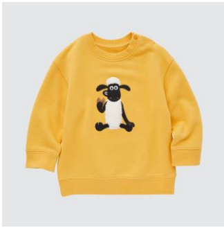
クレイアニメーション スウェットシャツ (長袖) 1,990 円(税込)