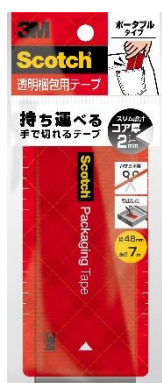
スコッチ® 透明梱包用テープ ポータブル

スリーエム ジャパン株式会社（本社：東京都品川区 代表取締役社長：宮崎裕子）が展開するスコッチ® ブランドより2021年7月15日、「スコッチ® 透明梱包用テープ ポータブル」を発売します。