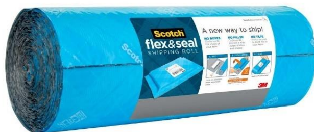
スコッチ ™ フレックス&シール 梱包ロール