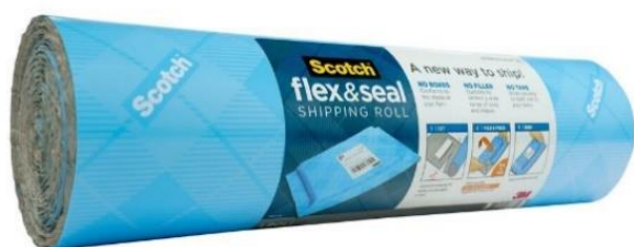
スコッチ ™ フレックス&シール 梱包ロール

スリーエム ジャパン株式会社（本社：東京都品川区 代表取締役社長：昆 政彦）が展開するスコッチ ™ ブランドは、2020年6月1日、「スコッチ ™ フレックス&シール 梱包ロール」を発売します。