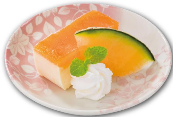
●メロンカタラーナ 440円 濃厚なカスタードアイスに北海道赤肉メロンを使用したソースを重ねたカタラーナです。

※稲沢店ではメニュー内容が異なります。※記載内容は急遽変更・中止する場合がございます。