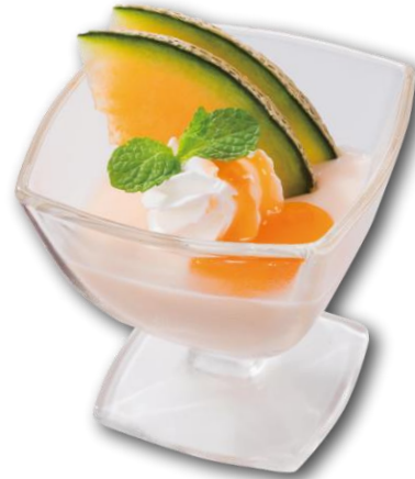
●メロン杏仁プリン 396円 口に入れると杏仁の香りとメロンの風味が広がる食後のデザートにぴったりの一品。