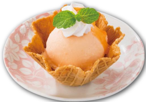
●北海道メロンジェラート 396円 北海道赤肉メロンの果汁を使用した、さっぱりとしながらメロンを感じられるクリーミーなジェラートです。