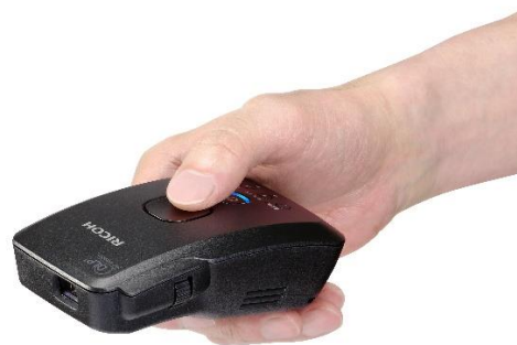
「RICOH Image Pointer GP01」

なお、本日よりECストアで予約受付を開始し、先着100名様にはオリジナルポーチをプレゼントするキャンペーンを実施いたします。