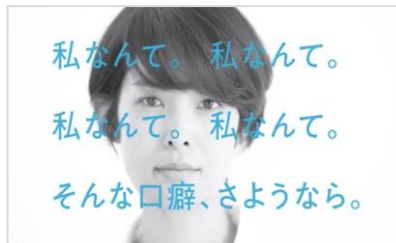
「I LOVE ME 30代篇」