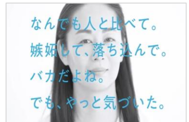
「I LOVE ME 40代篇」

https://youtu.be/A6_hsepZXhs https://youtu.be/FhVc3LpzmUY https://youtu.be/mMHKiZyqpg8