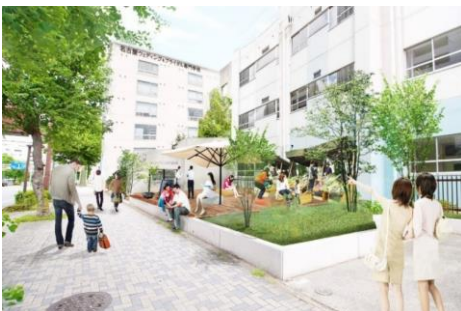
外観(施設西側より)