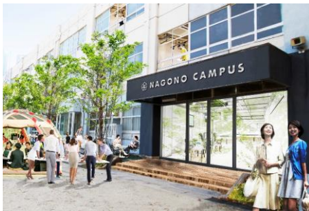
外観(グラウンド側より)