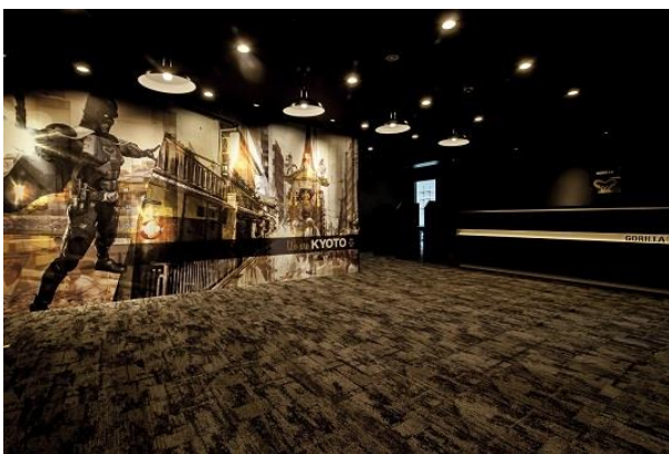
◎『ゴリラクリニック京都烏丸院』エントランス