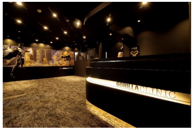
◎『ゴリラクリニック大宮院』エントランス