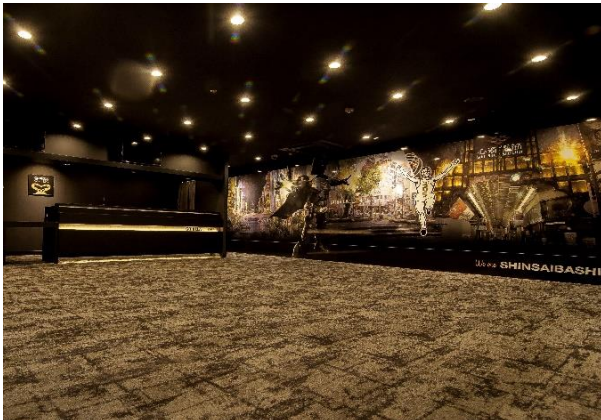
◎『ゴリラクリニック大宮院』エントランス

◎『ゴリラクリニック』ブランデッドムービー： https://www.youtube.com/watch?v=NM71PQk8G0k