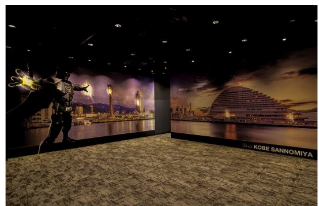
◎『ゴリラクリニック神戸三宮院』エントランス