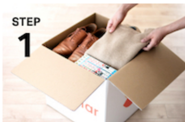
STEP 1 専用ボックスにアイテムを詰めて送るだけ

宅配収納サービス「サマリーポケット」は、専用ボックスに預けたい荷物を詰めて送ると、空調・セキュリティが徹底管理された環境でお預かりをする宅配収納サービスです。荷主自らが足を運ぶ従来のトランクルームとは異なり、宅配便を活用することで居住地域に関係なく、預けたモノを確認したいときも、取り出したいときも、自宅にいながらスマホ一つで操作が可能になります。