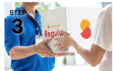
STEP 3 PC・スマホからいつでも簡単に取り出し可能