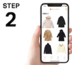
STEP 2 倉庫スタッフが1点ずつ撮影。預けたモノはスマホで管理！