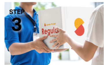
STEP 3 PC・スマホからいつでも簡単に取り出し可能