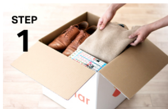
STEP 1 専用ボックスにアイテムを詰めて送るだけ

またお預かりする荷物は、ワインや美術品の保管も手がける保管のプロ・寺田倉庫でお預かりしています。温度・湿度のコントロールを24時間365日（1日2回のチェック）実施し、カビの発生しにくい環境を常に保持しています。またクリーニングやハンガー保管などの充実のオプションサービスもご用意し、多様なライフスタイルの中で利便性高くお部屋の収納に活用していただけます。