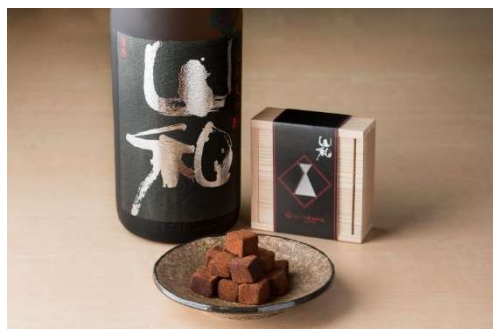
山和生チョコレート 16粒入り 1,944円(税込)

日本ソムリエ協会認定SAKE DIPLOMAの日本酒ソムリエが監修したSAKEMARIA<日本酒シリーズ>。 優しい甘みと華やかな香りの、フルーティーな日本酒。その味わいは今まで日本酒に興味がなかった層に刺さり、一躍人気銘柄に。 甘さと香りを意識して、ホワイトチョコを使用した生チョコに仕上げています。 【アルコール度1.3%】