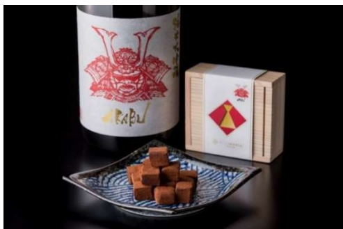
赤武生チョコレート 16粒入り 1,944円(税込)

日本ソムリエ協会認定SAKE DIPLOMAの日本酒ソムリエが監修したSAKEMARIA<日本酒シリーズ>。 食事の邪魔をしない究極の食中酒。甘さを抑え、香りも僅か。端麗ですっきりとした味わいの山和の日本酒をビターチョコと合わせることで、爽やかなカカオの香りと心地よい苦みを引き立たせました。 【アルコール度1.8%】