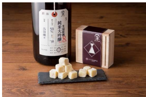
加茂錦生チョコレート 16粒入り 1,944円(税込)

世界中の人々から注目を集める日本酒。この度シルスマリアがお届けするのは、これからの日本酒文化をリードする酒蔵家たちのこだわりぬいた逸品を、それぞれの特徴に合わせたチョコレートの配合により作り出した唯一無二の生チョコレートです。口の中いっぱい広がる豊かな香りで至福のひと時をお楽しみ下さい。