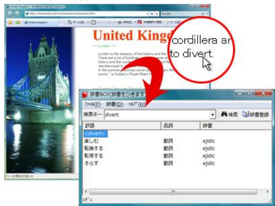
<ポップアップ辞書イメージ>

わからない単語にマウスオーバーするだけの簡単操作で、単語の意味を瞬間表示できます。 (日本語、英語両対応)