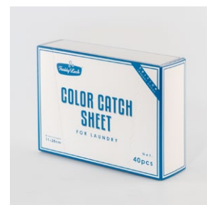
COLOR CATCH SHEET 40P ¥1,000