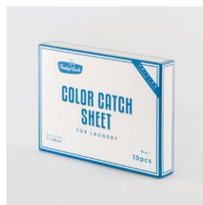
COLOR CATCH SHEET 10P ¥300