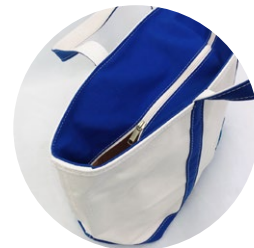
お洗濯物が見えないように できるジップ・トップ