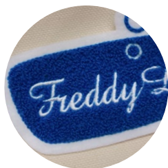
立体感のあるロゴワッペン

“トートバッグの元祖”を展開するアウトドアブランドに別注をかけた 究極の“ランドリー”トートバッグ