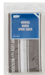
スペアカバー ¥2,000(本体価格)

1924年創業のアイロン台メーカーの老舗「サイトウ・アイロン・ボード」による、オリジナルデザインです。特許取得の丸みがあったボードの形状が、衣類の曲線にフィット。アイロンとの摩擦を軽減し、軽くスムーズなアイロンがけをすることができます。