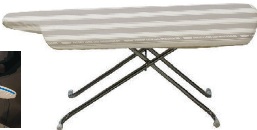
フレディ サイトウ アイロニングボード フロアタイプ ¥20,000(本体価格)