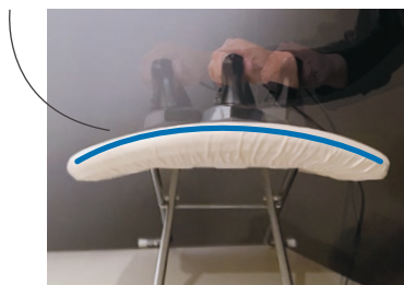
カーブしたボードは サイトウ・アイロン・ボードの特許技術！ 特許番号：第 3871212 号

アイロンがボードと面ではなく"点"で接するため摩擦が少なく、通常の30%の力でアイロン掛けをすることができます