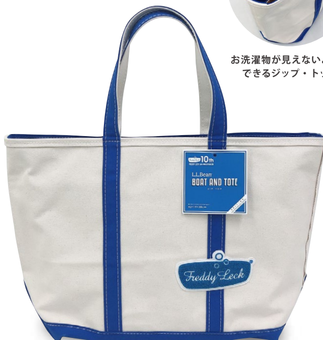
ボート・アンド・トート ジップ・トップ ¥13,000 (本体価格)

トートバッグの元祖と言われるボートアンドトートを販売する「L.L.Bean」とコラボレーション。フレディ レックの「ランドリーバスケット スリム」と同量の洗濯物がゆったりと入るサイズ感。丈夫な 24 オンスのキャンバス生地に、立体感のあるロゴワッペンを配したデザインです。