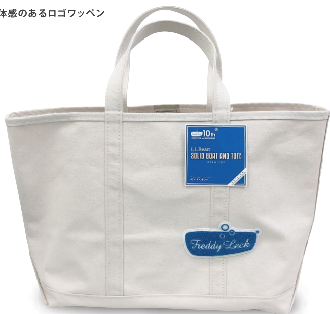
ソリッド・ボート・アンド・トート オープン・トップ ¥13,000 (本体価格)