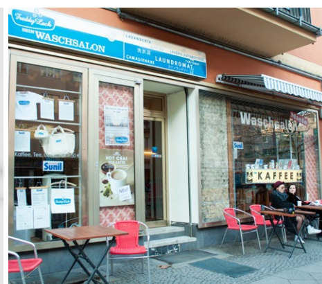
フレディ レック・ウォッシュサロンベルリン