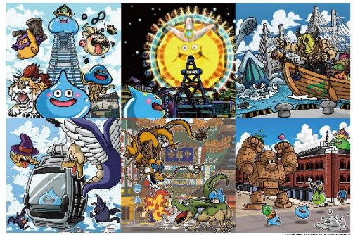
イベントオリジナルイラスト

ランドマークプラザ・MARK IS みなとみらい両施設の6箇所に、スタンプラリーのポイントを設置。施設内を歩き回り、「ちいさなメダル」のスタンプを集め、全てのスタンプをコンプリートした方には、イベントオリジナルのイラストが描かれた特製ステッカーをプレゼントいたします。