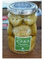
小白井きゅうりのピクルス