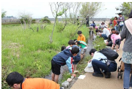
BIOBIOかつぱの里で 生き物と触れ合う子どもたち

アクアマリンふくしま（福島県いわき市）は、7月から9月までの夏休みの期間、自分だけのオリジナル図鑑を作ることのできるイベントや、生き物に関する子どもたちの様々な疑問に答えるイベントなど、生き物のことを楽しみながら学ぶことのできる様々なイベントを開催し、子どもたちの自由研究を応援します。また、金魚すくいや、輪投げ等を楽しむことのできる金魚まつり&おたのしみ縁日を8月11日から8月15日まで開催いたします。