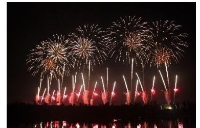
蛇の目ビーチより見る いわき花火大会