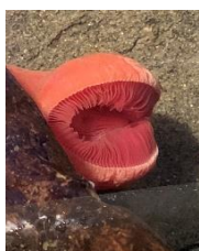
サンゴノフトヒモ