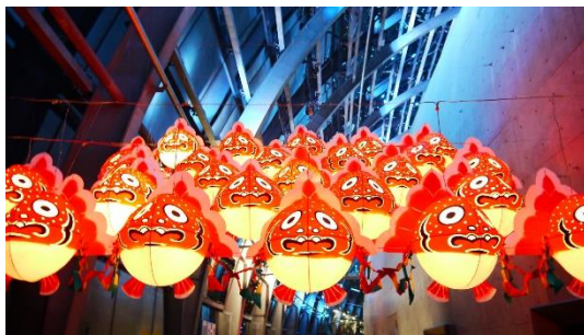
点灯した金魚ねぶた