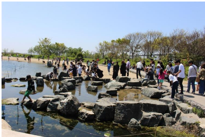
賑わいをみせた蛇の目ビーチ

アクアマリンふくしまでは、本年度のゴールデンウィーク（以下GW）期間（4月27日～5月6日）の入館者数が70,665人となりましたのでお知らせいたします。なお、GW期間中の入館者実績は下記のとおりです。クラカケアザラシやGWに合わせて展示したオオメンダコなど、当館だけでしか見られないレアな生物が話題を集めました。その他、GW特別企画の宝探しイベントや、大水槽のイワシに飼育員が潜水給餌するイベントも人気でした。常設の体験コーナーの中でも、釣り体験は、2時間先の整理券が配られるほどたくさんの方にご参加いただきました。