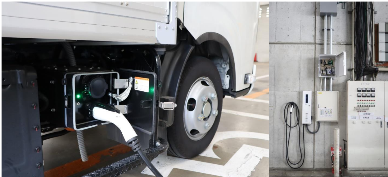
《EV 充電と施設電力使用量を連携させている R.E.A.L. New Energy Platform®の基盤》