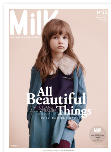
ミルクジャポン No22 (Autumn 2013)

最新号『ミルクジャポン』No22 は、本国フランスの MiIK10 周年を記念したスペシャルイシューです。ミルクジャポンがセレクトしたキッズファッション 10 ブランド、10 スタylingを撮り下ろした秋冬ファッション特集を皮切りに、子どもたちとその家族の特別な秋を演出する構成です。またヨーロッパで人気のインテリア版 MiIK「別冊ミルクデコレーション」が日本初登場します。