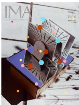
雑誌『IMA』2013 WINTER vol.6

世界には見るべきすぐれた写真がたくさんあります。日本には写真ファンがたくさんいます。『IMA』は、その両者をつなぐ雑誌です。旬の写真作品やフォトグラファーの声、写真の歴史や世界の最新情報などを満載して、写真をめぐるさまざまな楽しみをお伝えします。