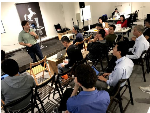
（講義ではシリコンバレーの元起業家が直接指導）

多くの企業が神戸を通じて成長し、世界で活躍いただけるよう、引き続き、スタートアップ支援に取り組んでいきます。