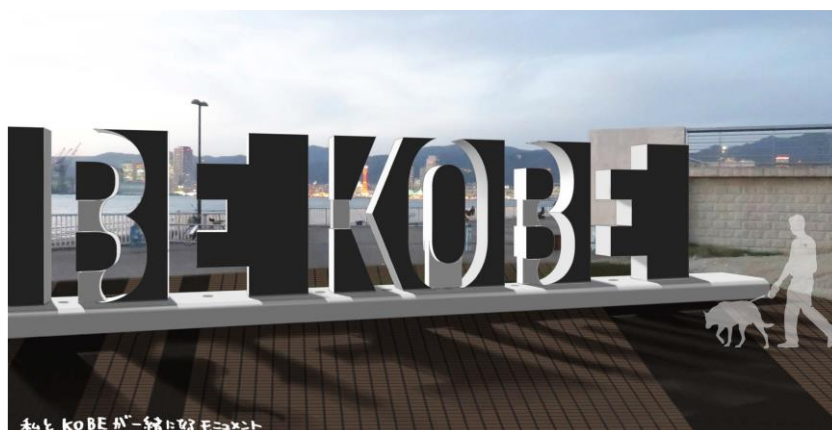
「BE KOBE」モニュメント イメージパース

ぜひ一度、現地に足を運んでいただき、神戸の夜景に新たな彩りを加えた「BE KOBE」をご覧ください。