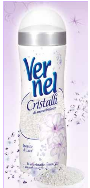
ヴァーネルクリスタル ホワイトブロッサム

今まで日本では、香りのないものや微香の商品が主流でした。しかし、最近では香水文化の根付いている欧米では当たり前だった普段の生活で香りをまとうことが、海外商品好きの一部の主婦層から広まったことや、住宅事情などから部屋干しが増えてきたこともあり、香りの柔軟剤が日本でも定着してきました。そのような中、当社が女性を対象に行った調査では、半数以上の人が洗濯物の柔軟剤の香りを調整したいと思っていることが判明しました。