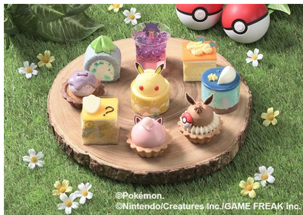
▲ピカチュウ、イーブイ、リザードンなど、ポケモンたちをカラフルなプチケーキで表現。