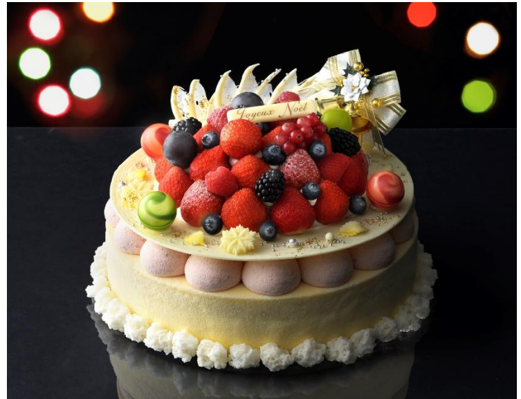
▲上面のフルーツ：苺、ラズベリー、ブルーベリー、ぶどう（シャインマスカットなど）、赤すぐり、ブラックベリー

◆税込価格は1円未満を切り下げて表示しております。一部店舗では実際のお買い上げ価格と差額が生じる場合がございます。