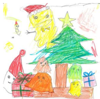
「おばけのクリスマスパーティー」