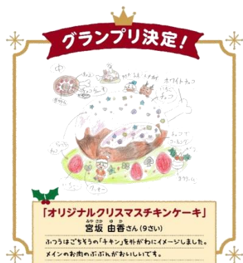
「オリジナルクリスマスチキンケーキ」